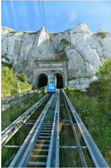
« Le Funiculaire »