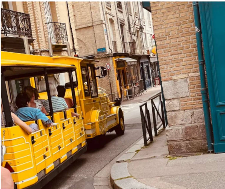
Digestion en transport en commun

Le parcours nous mènera du port de plaisance aux vieux quartiers, en longeant le front de mer et en passant par l'esplanade du château de DIEPPE