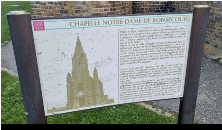
Pique-nique au pied de l'église Notre- Dame-de-Bon-Secours