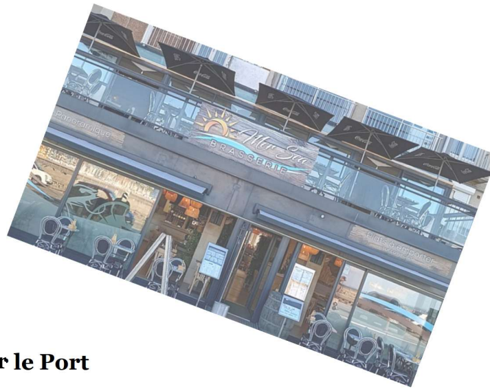
Dernier restaurant sur le Port